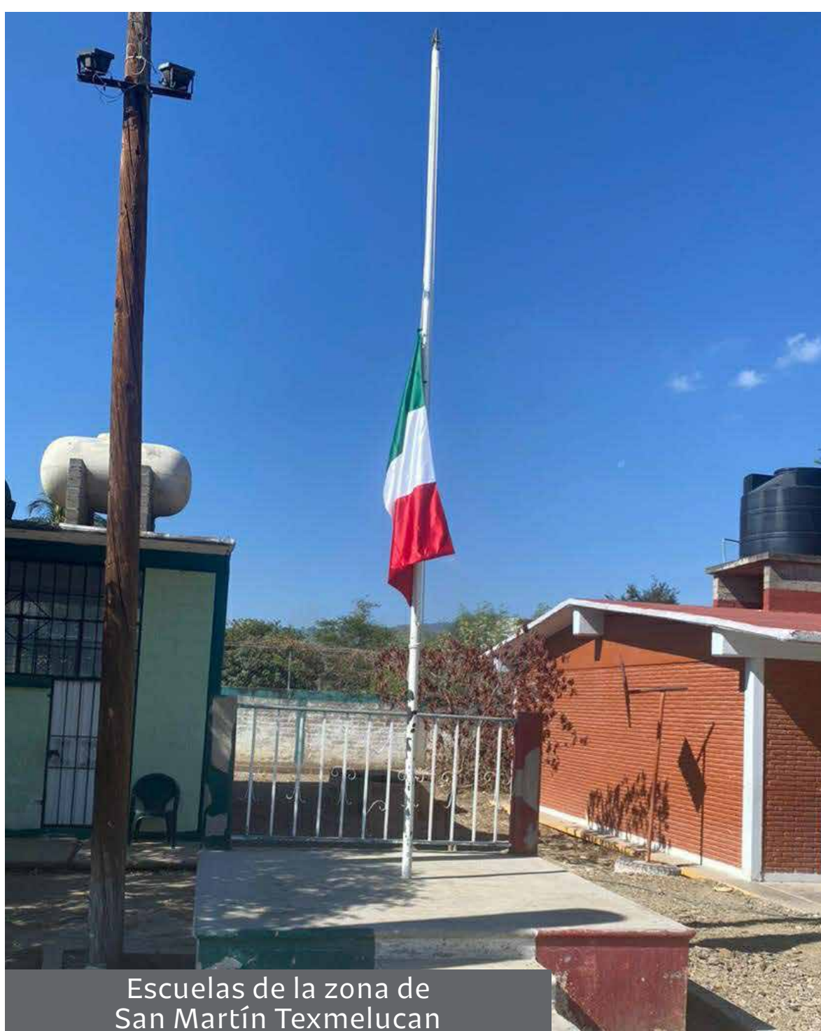
Escuelas de la zona de San Martín Texmelucan