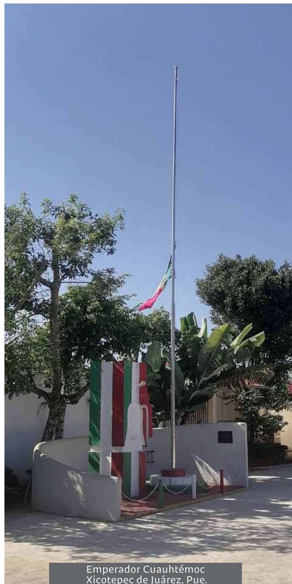
Emperador Cuauhtémoc Xicotepec de Juárez, Pue.