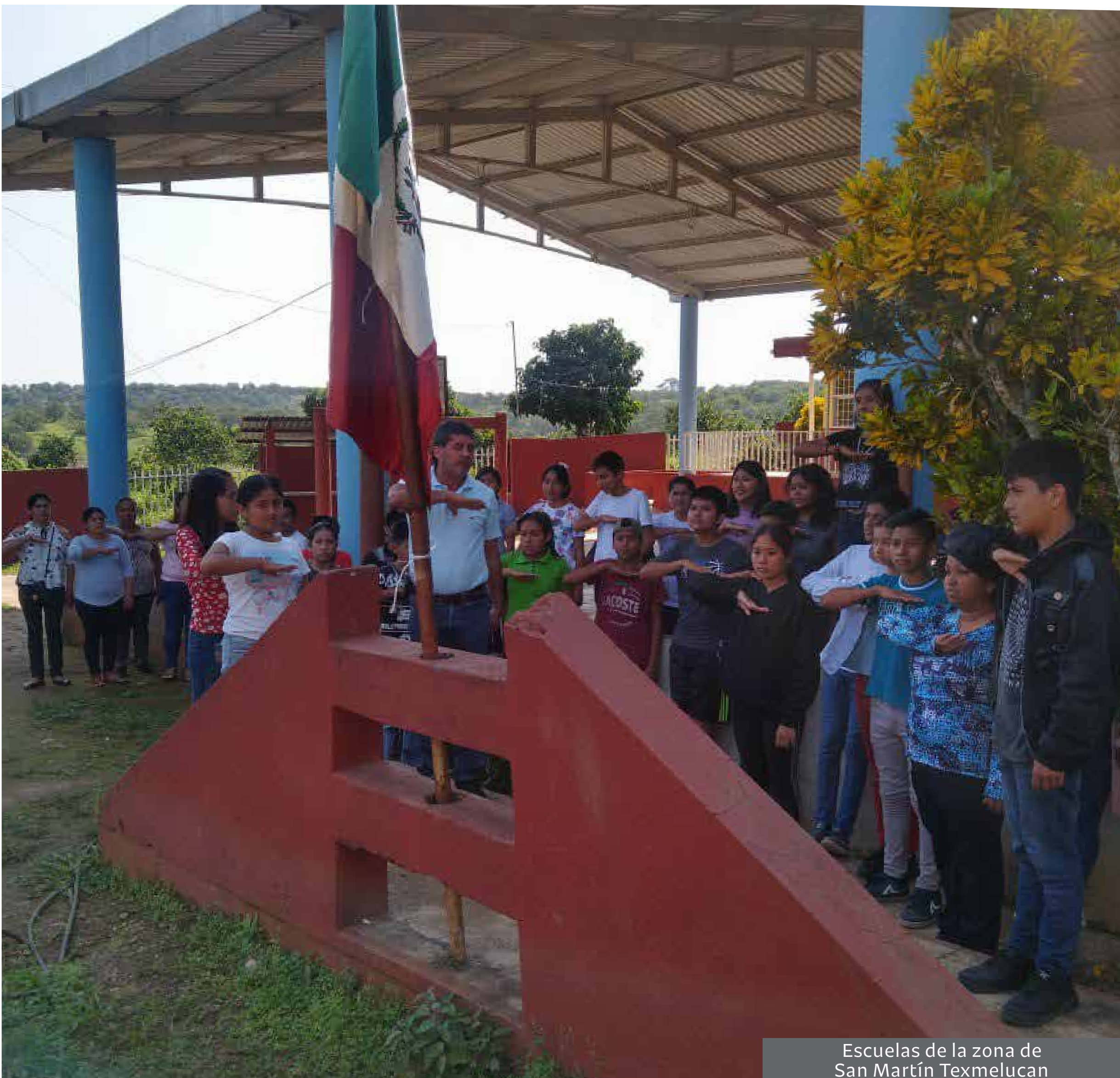
Escuelas de la zona de San Martín Texmelucan