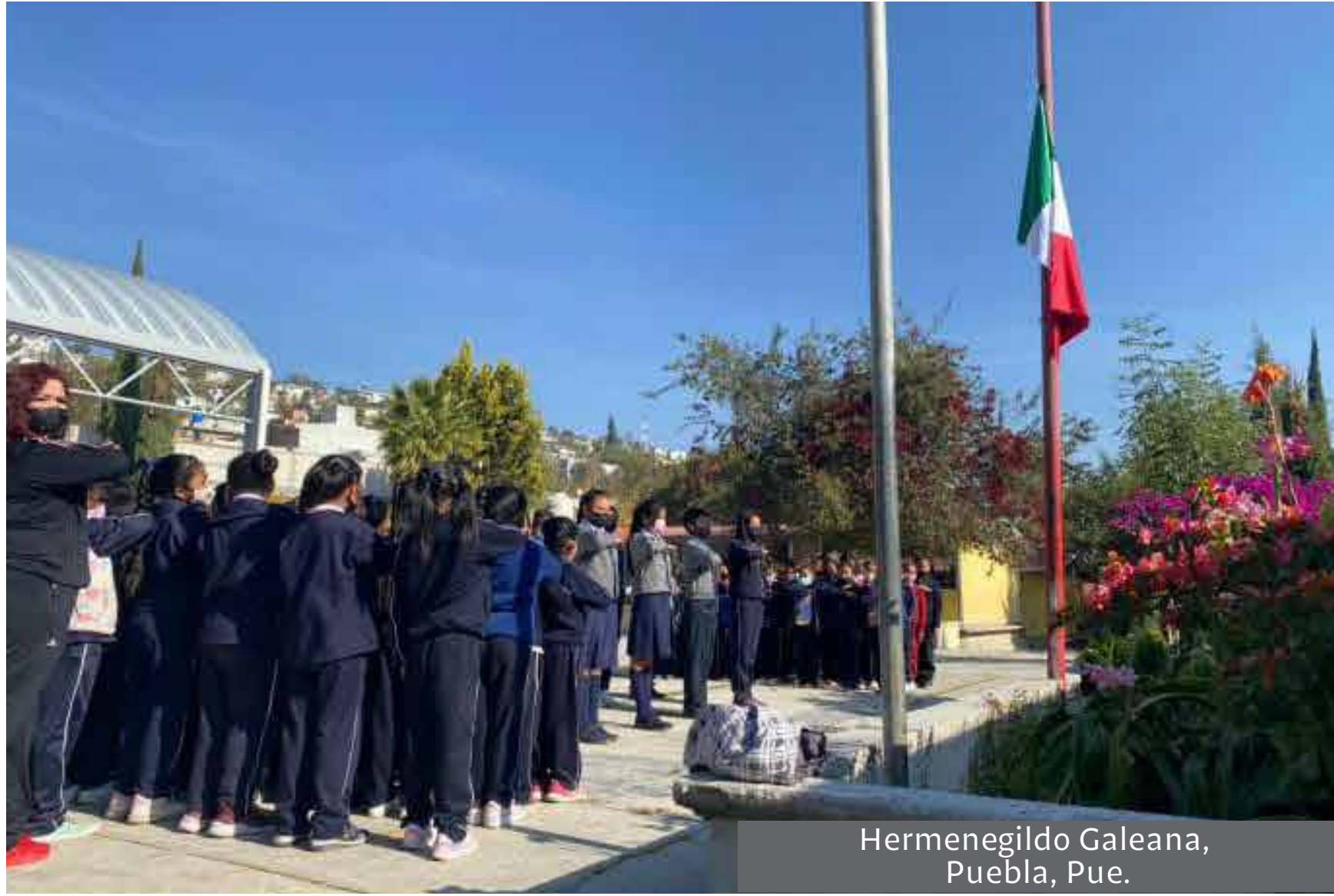
Hermenegildo Galeana, Puebla, Pue.