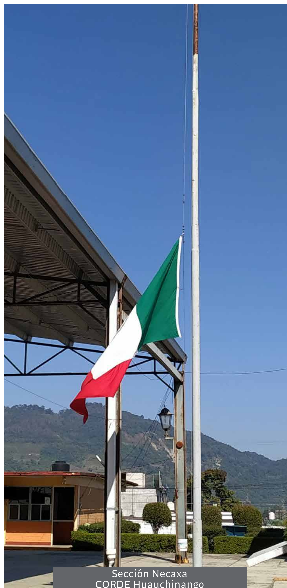
Sección Necaxa CORDE Huauchinango