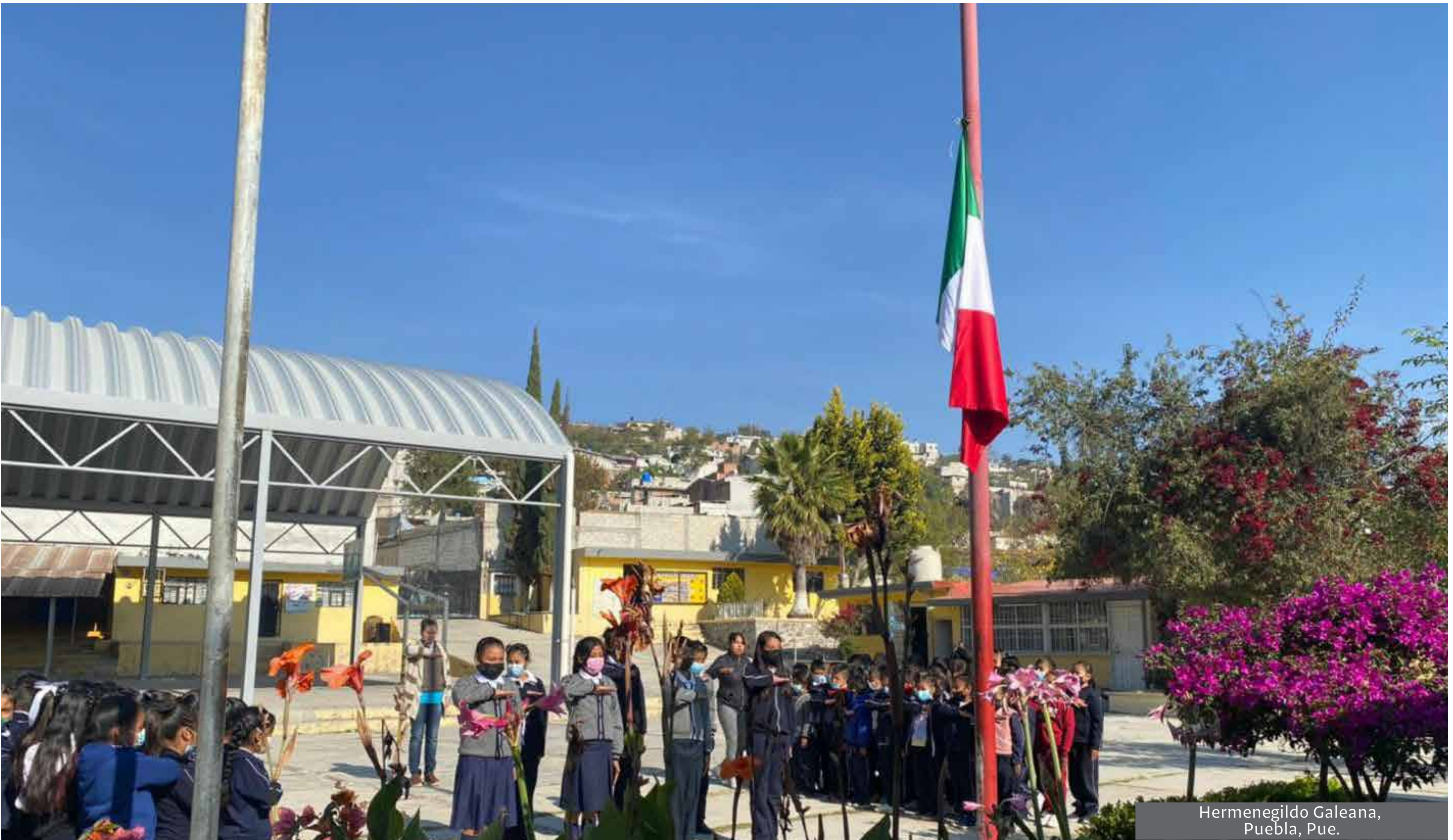
Hermenegildo Galeana, Puebla, Pue.