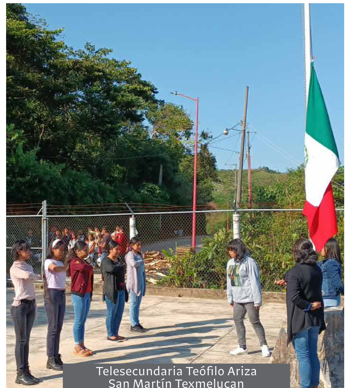
Telesecundaria Teófilo Ariza San Martín Texmelucan