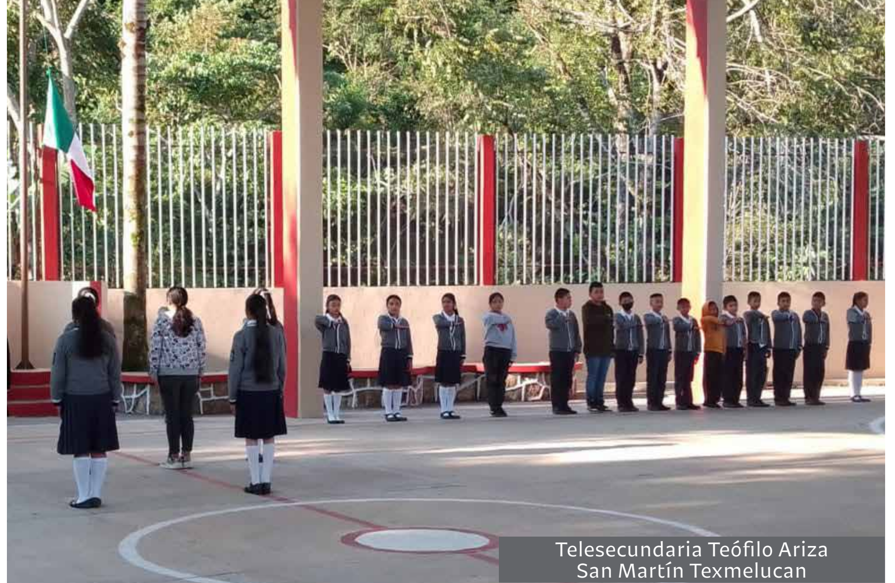
Telesecundaria Teófilo Ariza San Martín Texmelucan