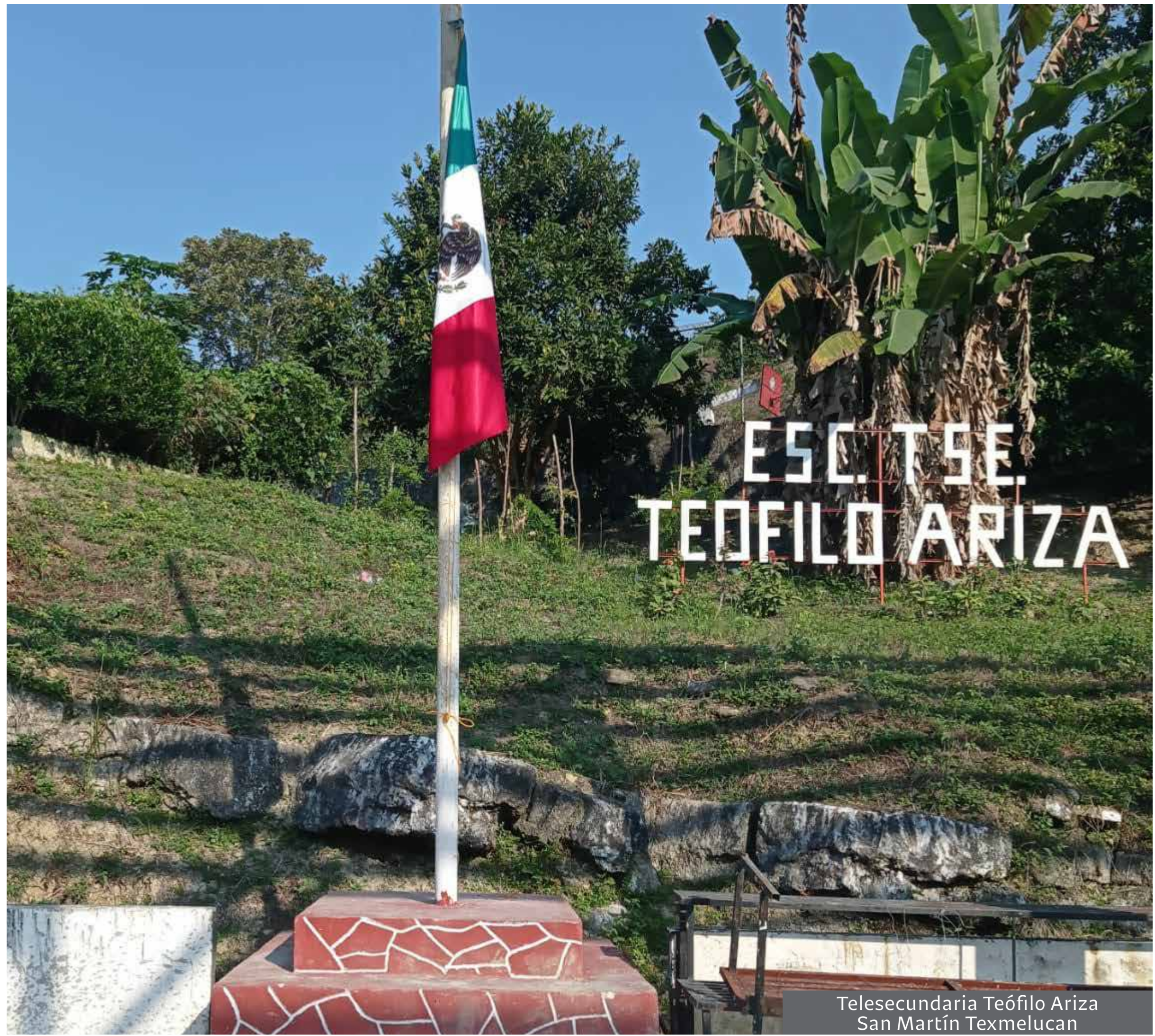
Telesecundaria Teófilo Ariza San Martín Texmelucan