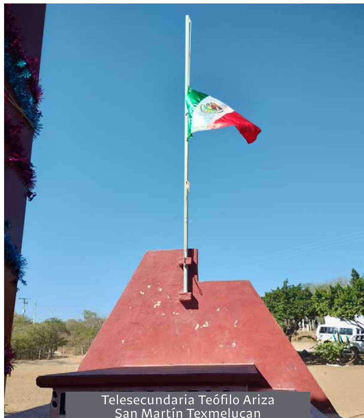
Telesecundaria Teófilo Ariza San Martín Texmelucan