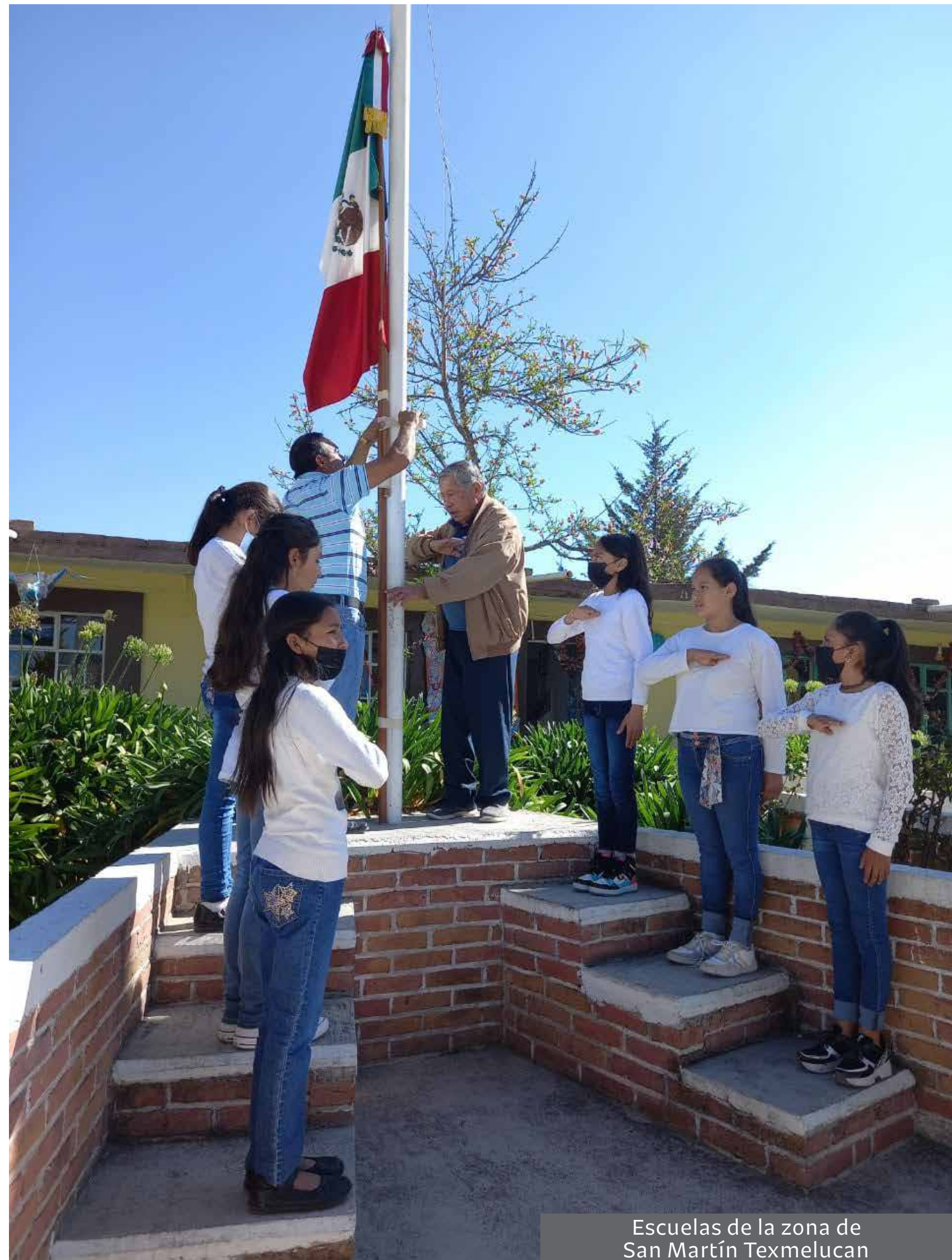
Escuelas de la zona de San Martín Texmelucan

Instituciones de educación pública, desde preescolar hasta media superior izarán la bandera a media asta durante los días 14, 15 y 16 de diciembre, por el sensible fallecimiento del gobernador del Estado Miguel Barbosa Huerta. La comunidad educativa se suma al luto que embarga al entidad.