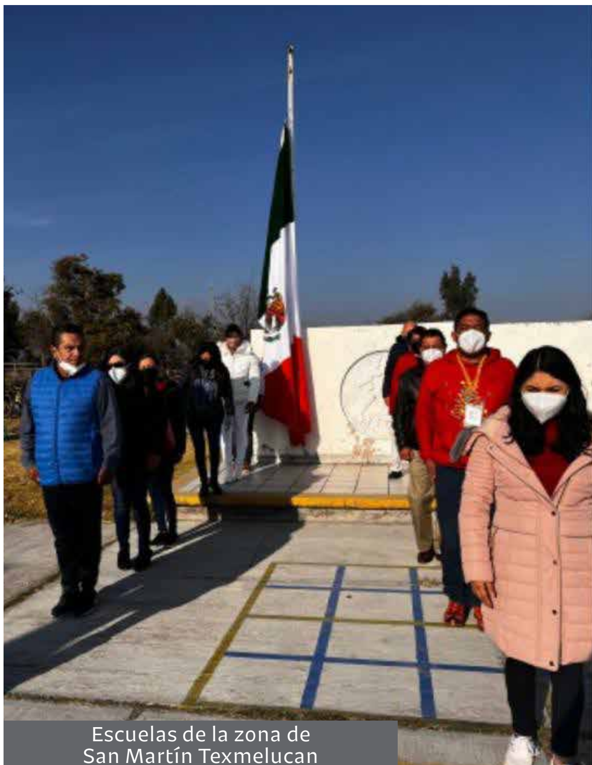
Escuelas de la zona de San Martín Texmelucan