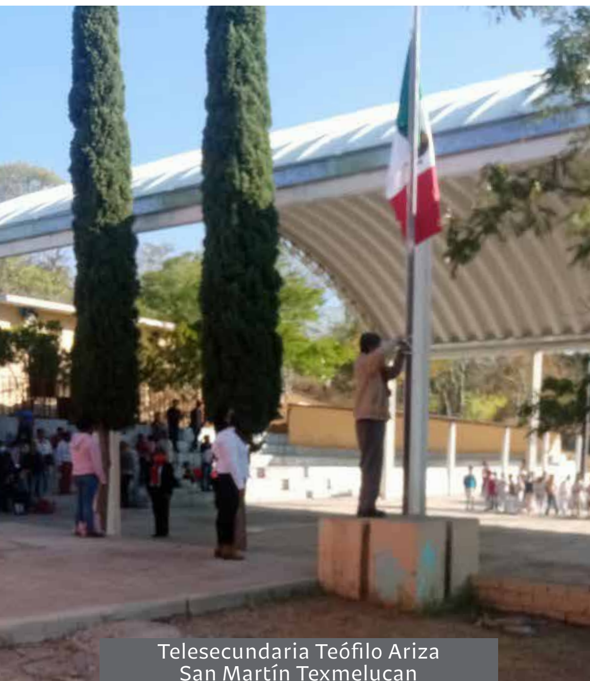
Telesecundaria Teófilo Ariza San Martín Texmelucan