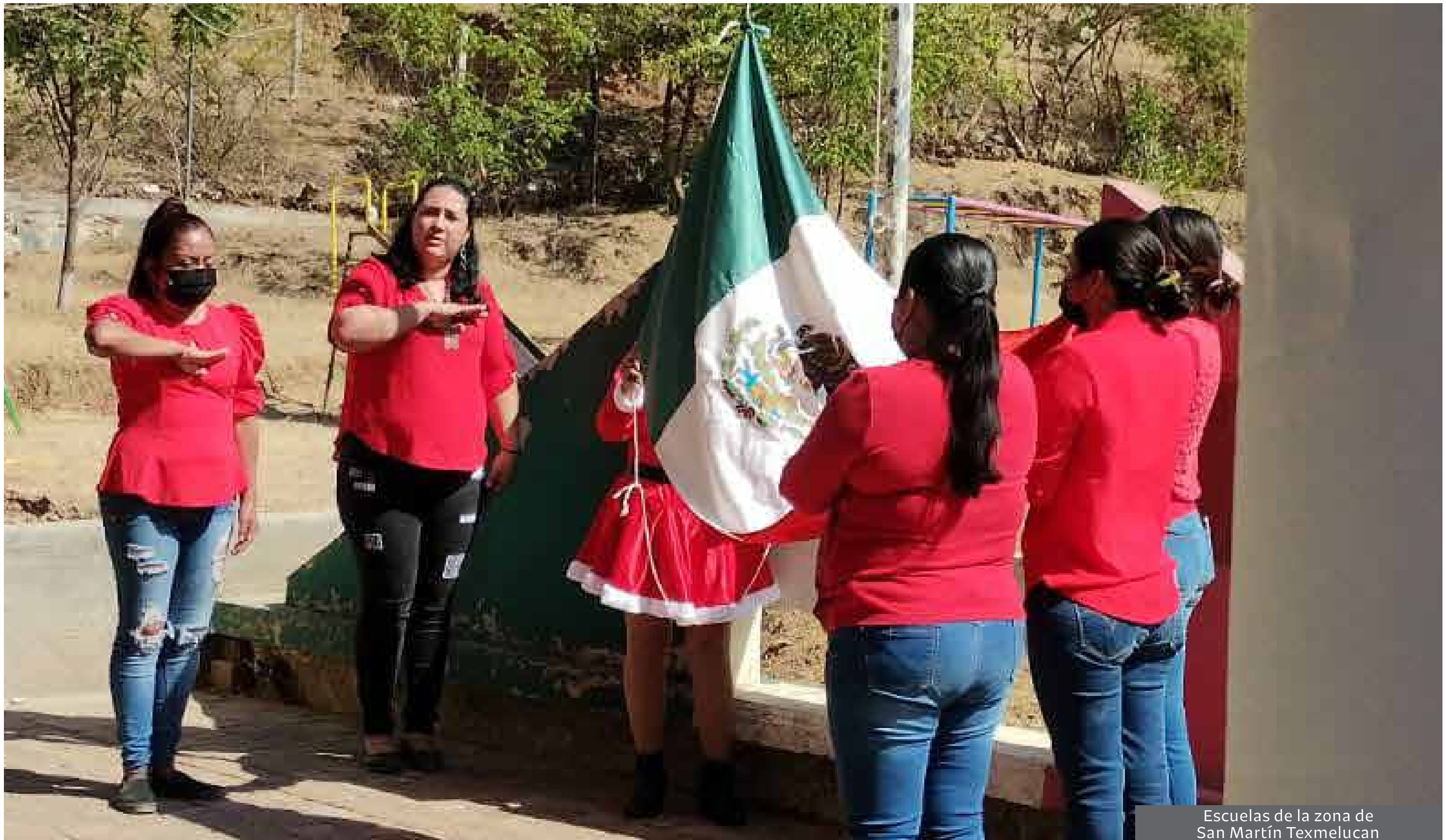
Escuelas de la zona de San Martín Texmelucan