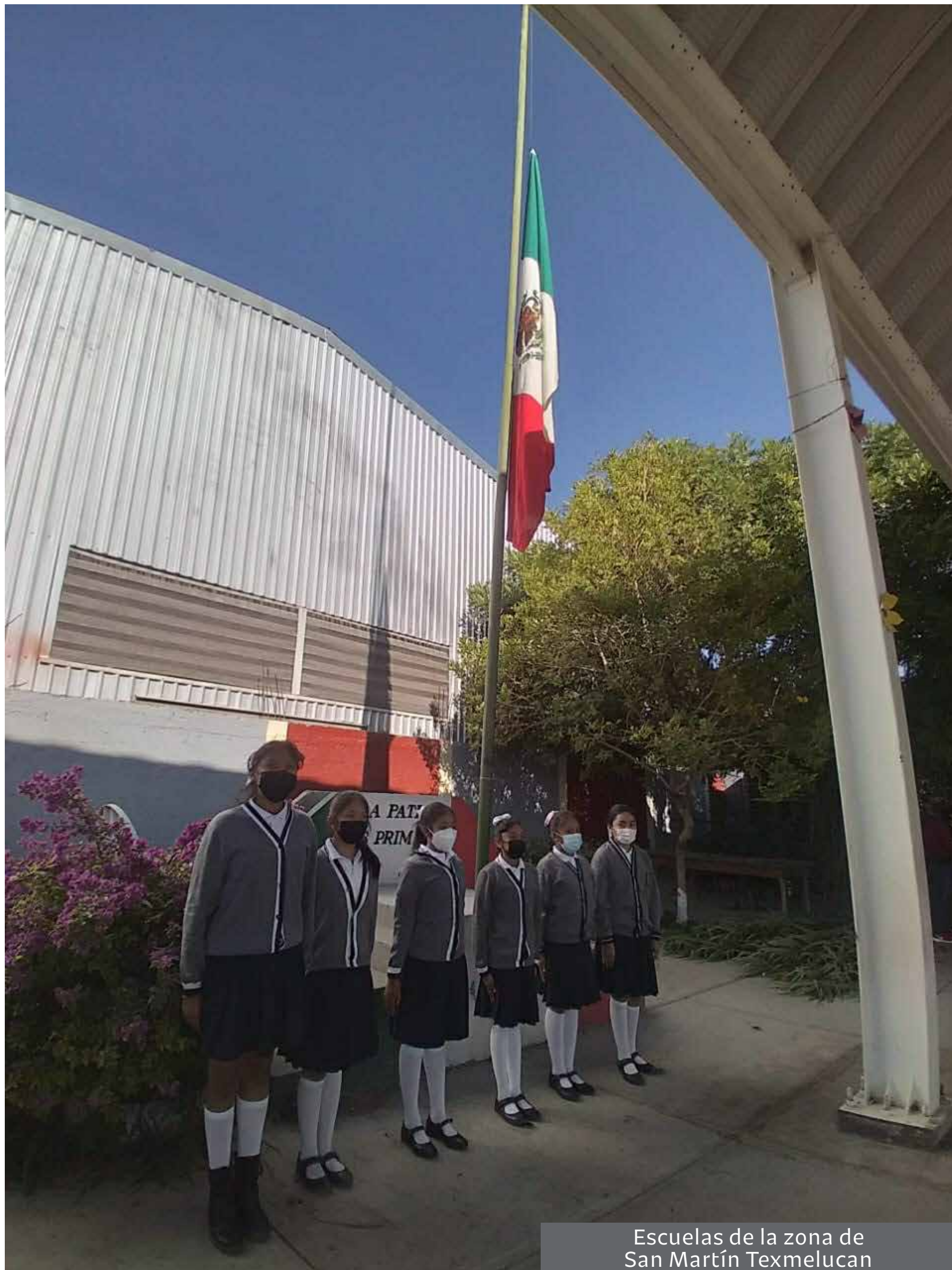
Escuelas de la zona de San Martín Texmelucan