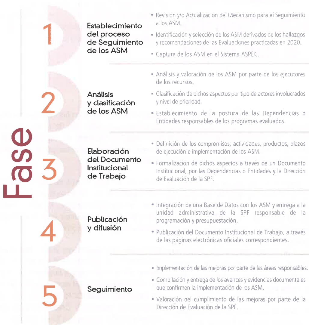
Figura 1. Proceso de Seguimiento a los ASM 2021.

El proceso de seguimiento de los ASM es participativo, la Dirección de Evaluación de la Secretaría de Planeación y Finanzas se vincula y coordina con los Enlaces Institucionales de las dependencias y entidades a través sistema ASPEC; con el propósito de que los ASM sean analizados, clasificados y retroalimentados, y que la formalización de estos, se lleve a cabo de forma consensuada.